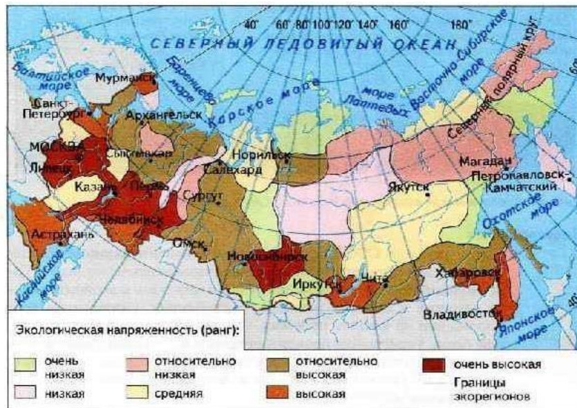
Рис. Эколого-географическое положение России.

Территориальные сочетания природных ресурсов, ресурсные циклы. Оцените природно-ресурсный потенциал страны.