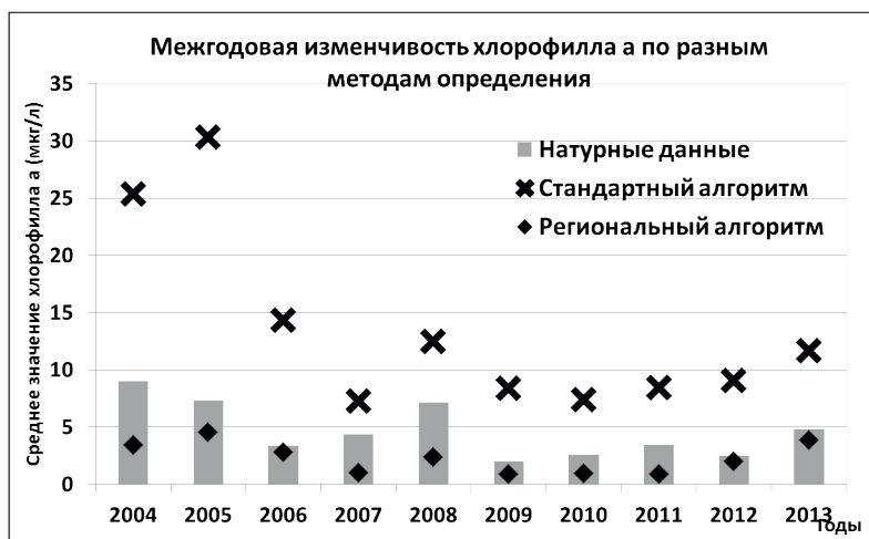
Рис. 2. Средние концентрации хлорофилла, рассчитанные для станций по данным натуральных измерений (ромб), стандартному алгоритму ОСЗМ (крест) и региональному алгоритму (столбик)

Как видно на рис. 2, региональный алгоритм на протяжении всех 10 лет гораздо устойчивее согласуется с данными натуральных измерений по сравнению со стандартным алгоритмом. Тем не менее региональный алгоритм несколько занижает значения концентраций хлорофилла a , в среднем на 2,11 мкг/л. Это может